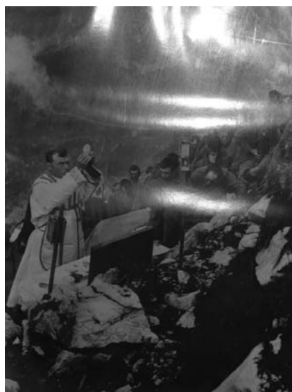
Santa Messa sul l'Ortigara, prima del massacro

Monsignor Pelvi però non è in pensione dalla carica vescovile (le dimissioni avvengono al 75° anno di età) ma anzi gli verrà assegnata una diocesi come a tutti gli altri vescovi.