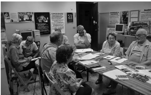
L'incontro della redazione di TdF con i Viandanti

I due rappresentanti ci hanno spiegato la loro storia ed il loro operato, nonché le iniziative che hanno messo in campo: convegni, seminari di studio ed anche una “Lettera