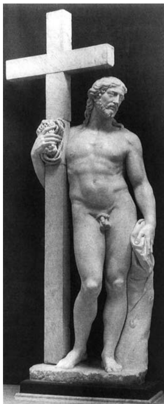
Le due versioni della statua del Cristo risorto, realizzate da Michelangelo nel 1521, citate nel testo