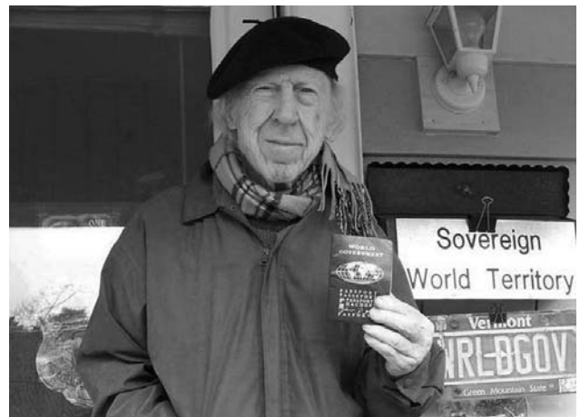
Garry Davis mostra il suo Passaporto di Cittadino del Mondo