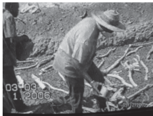
La distruzione delle uova di cavalletta

strappare da una terra avara per il loro sostentamento. La natura, con i suoi elementi, sa essere benigna e apportatrice di vita, ma può anche essere crudele e distruttiva come certe divinità che la rappresentano. Da sempre gli uomini si confrontano con questi due aspetti di una madre che pare voler mettere sempre alla prova i suoi figli, affinché non smettano mai di proseguire nel loro cammino di ricerca di un senso della vita.