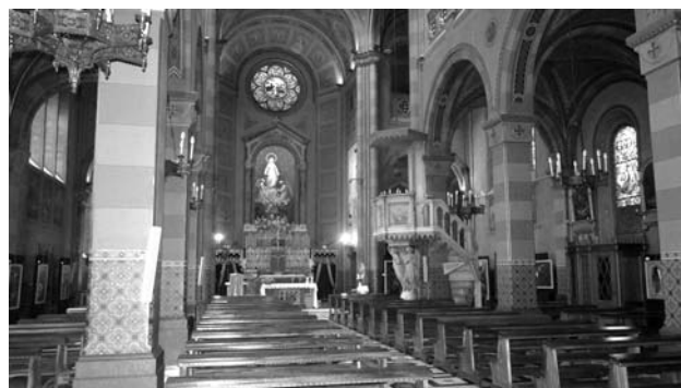
Il frontale e l'interno della chiesa di Nostra Signora del Suffragio e di Santa Zita, costruita da Francesco Faà di Bruno. A destra in alto, il campanile: con i suoi 83 metri, è il più alto campanile di Torino.