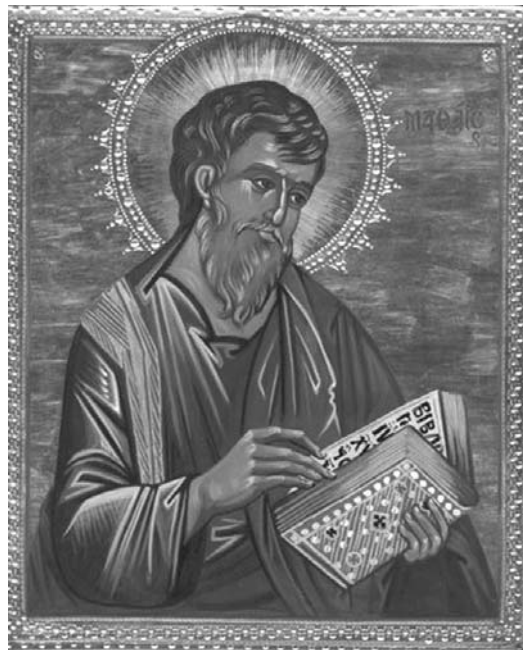
Icona di San Matteo

San Tommaso lo diceva nella Summa Teologica che l'essere umano, tutto il male che compie, lo compie "sub specie boni". È l'illusione che ci abita, fare il male credendo che sia il nostro bene. È la voce del serpente del Genesi: "Ma il serpente disse alla donna: «Non morirete affatto! Anzi, Dio sa che quando voi ne mangiaste, si aprirebbero i vostri occhi e diventeste come Dio, conoscendo il bene e il male».