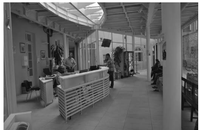
L'accoglienza del nuovo Ufficio Migranti