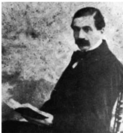
Francesco Faà di Bruno

Come nella sceneggiatura di un film, proviamo a tratteggiare la personalità e l'avventura di uno dei più dimenticati, forse perché il più atipico: Francesco Faà, il più giovane dei dodici figli (nato nel 1825) del fratello del vescovo Antonino, Ludovico marchese di Bruno, conte di Carentino, signore di Fontanile, una famiglia di nobiltà di campagna (tra il Basso e l'Alto Monferrato, diventato astigiano nel 1935).