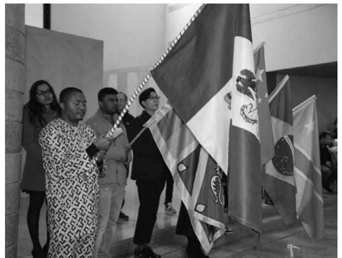
Immagini della Festa dei Popoli, tenutasi il 6 gennaio 2016 al Santo Volto