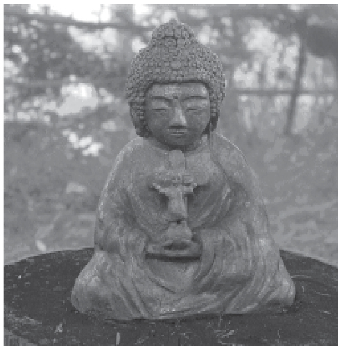
Nel tondo del Buddha l'amore del Cristo

Za significa "seduta", zen traduce il termine "meditazione". Zazen è quindi la meditazione da seduti, comune a tutte le scuole zen. Zazen comporta l'unione di tre elementi: controllo del corpo, della respirazione e della mente. Se in altre correnti dello Zen la pratica zazen porta a uno stato di illuminazione più o meno profondo, nella corrente soto del