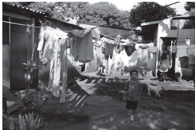
Baracche in Nicaragua

Unicredit Banca iban: IT22 1020 0801 1170 0000 2281813 segnalando la causale.