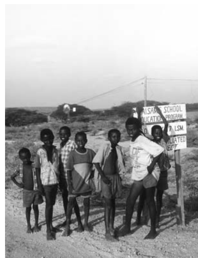
Interventi in Kenia

Un libro, una storia, per comprendere meglio il presente, e ricordando il passato, "inventando" il futuro. Le immagini sono un "richiamo" alla storia e forse capirne alcuni perché.