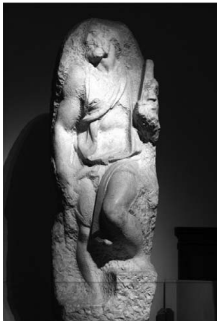
Michelangelo, San Matteo (1505) Firenze, Galleria dell'Accademia

Gesù ordina dunque di cacciare via quel modo di affrontare la morte, e poi il testo ripete, quando fu cacciata... Vuol dire che questo atteggiamento è difficile da scalzare, e al vangelo basta una frase per dire un percorso che dura una vita.