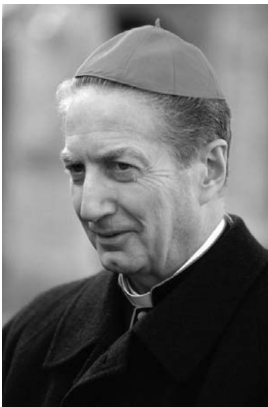
Il Cardinale Carlo Maria Martini

«La frase " Non ho tempo " la diciamo e l'ascoltiamo così spesso, che ci pare come un condensato dell'esperienza comune. Noi abbiamo un'acuta percezione della sproporzione tra il tempo che abbiamo e le sempre più numerose opportunità a nostra disposizione,