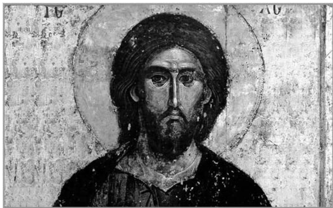
Cristo Pantocratore (sovrano di tutte le cose) Monastero di Chelandari, Monte Athos ca. 1260-70

I vangeli non sono opere storiche, tanto meno sono opere storiche nel senso odierno del termine. Sono piuttosto opere che hanno una finalità di fede, quella di annunciare e testimoniare la meravigliosa novità di Gesù alle donne e agli uomini di tutte le epoche e di tutte le culture. Nonostante ciò, i racconti evangelici presentano numerosi punti di contatto con il "fare storia" e forniscono non di rado elementi di