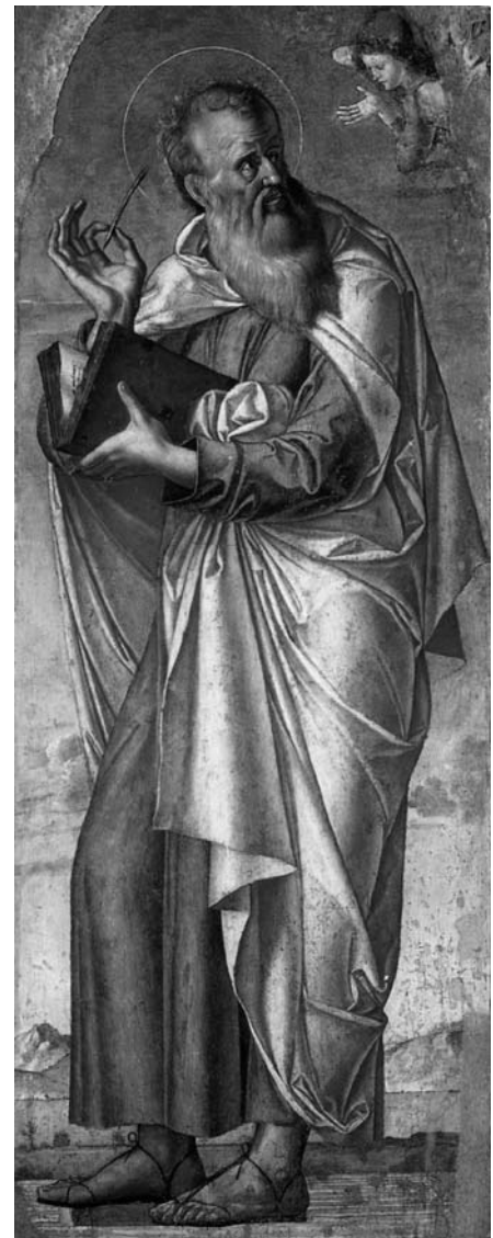
Alvise Vivarini - San Matteo (c. 1480) Gallerie dell'Accademia, Venezia

Ma anche lì si arriva a morire in maniera progressiva, non si può morire così, all'improvviso, e quando succede (perché si sono anche le morti improvvise), queste vite vanno riscattate, in qualche modo, perché sono vite incomplete. Questo perché si sta facendo un cammino, Dio si sta facendo con noi, e lì è come se Dio fosse stato bloccato nel divenire di quella persona. Se ognuno di noi è fatto a immagine e somiglianza di Dio, espressione del suo mi-