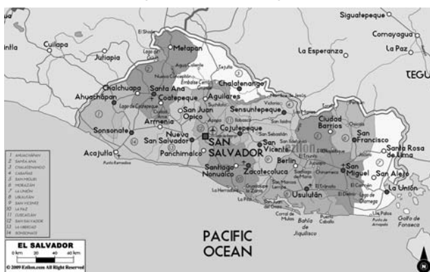
Carta politica di El Salvador

Il primo punto si riferisce alla revisione del ruolo delle Forze Armate, in particolare sospendendo il reclutamento forzato, eliminando i battaglioni speciali e dissolvendo la Guardia Nazionale; contemporaneamente si stabilisce di creare una nuova Polizia Nazionale Civile, totalmente indipendente dalle Forze Armate e diretta da civili.