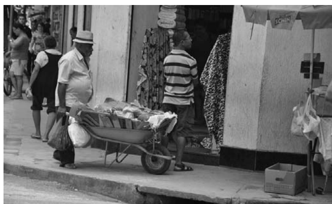
Nelle foto, immagini di vita quotidiana a Teófilo Otoni

Intanto, il progetto dell'APJ cammina con le proprie gambe: il seme gettato tanti anni fa sta dando i suoi frutti.